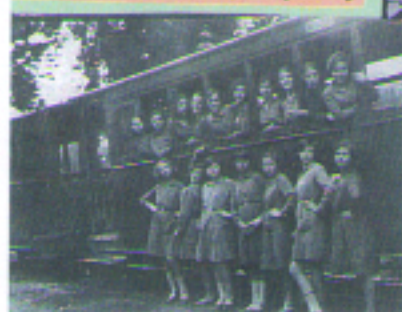
Μαθήτριες παζάρουν μέσα και έξω από τον «Μουτζούρη» το 1930.